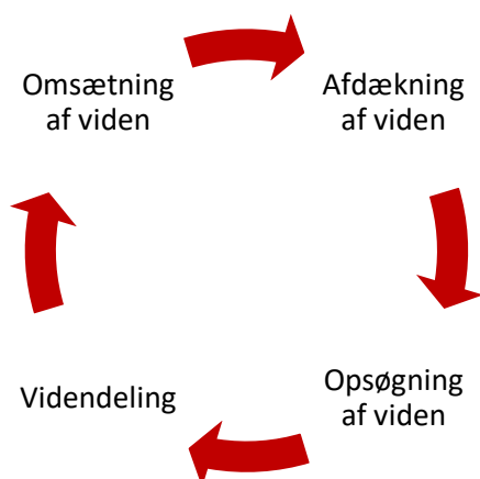
Figur 2 EASV's Omsætning af viden

Omsætningen af viden er, at underviserne nysgerrigt og løbende opsøger ny viden, der er relevant for deres fagområder, deler den på tværs og formidler den i undervisningen.